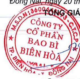
ĐẶNG NGỌC DIỆP